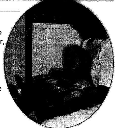
Pavlusyk with a therapist

Your Lenten donation will help these children realize their full potential.