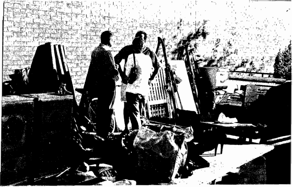
Friends meet and greet – and buy.