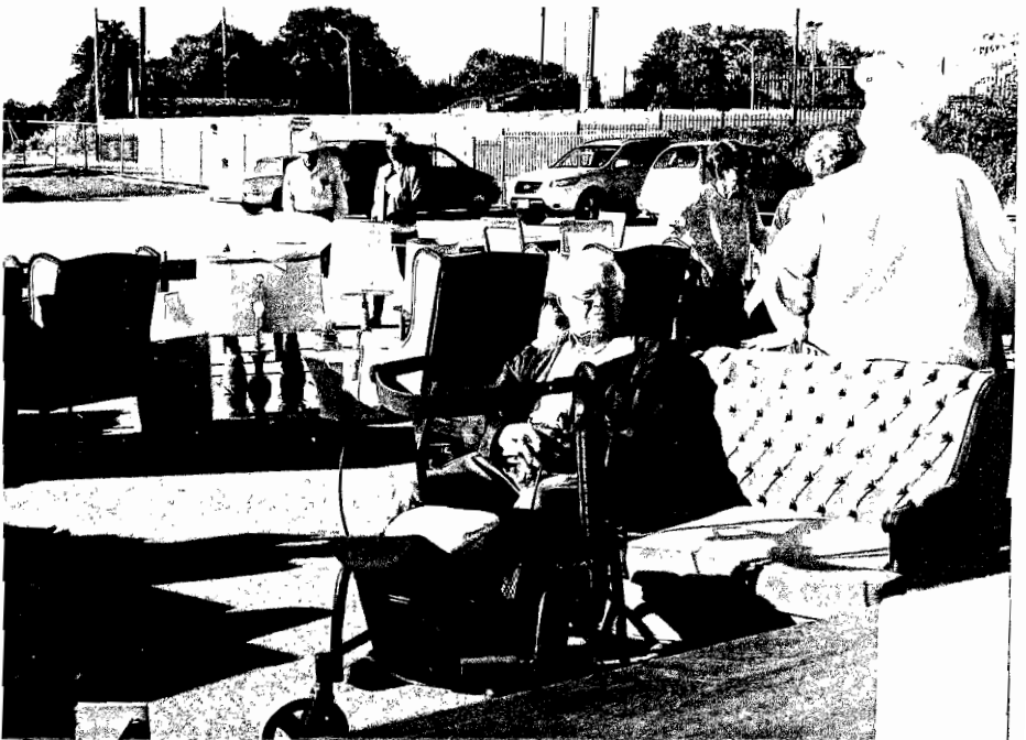
This love seat needs a partner.