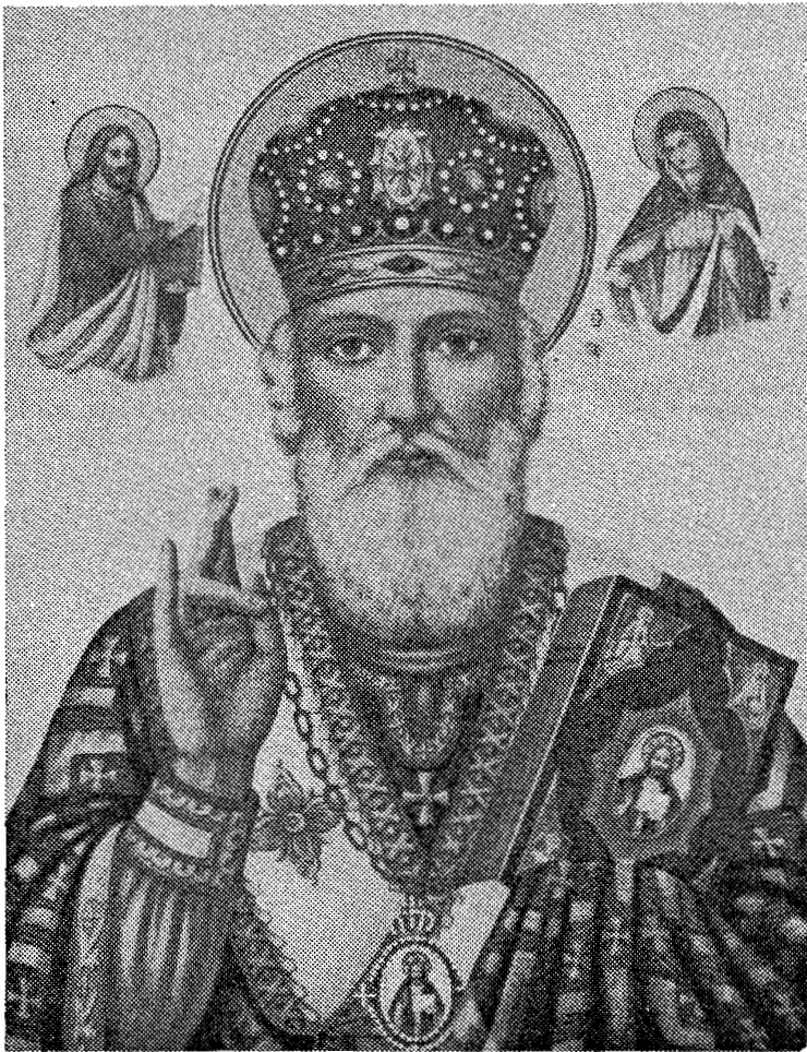
ICON OF THE BELOVED SAINT NICHOLAS

When the see of Myra in Lycia became vacant, it was Nicholas who was selected to become the archbishop of the church. The story goes that the council was undecided whom to select. Then a plan was revealed to one of the older prelates. He was told to go to church the next morning, and then to select as archbishop the first cleric who would come there to pray. Yes, it was Nicholas, as was his daily custom, who first entered the sanctuary for prayer.