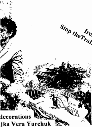
decorations jka Vera Yurchuk