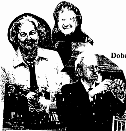
Smile, you're on candid camera! Our photographers: Marta Humeniuk, Kay Sklepowich, Dr. Walter Kowal